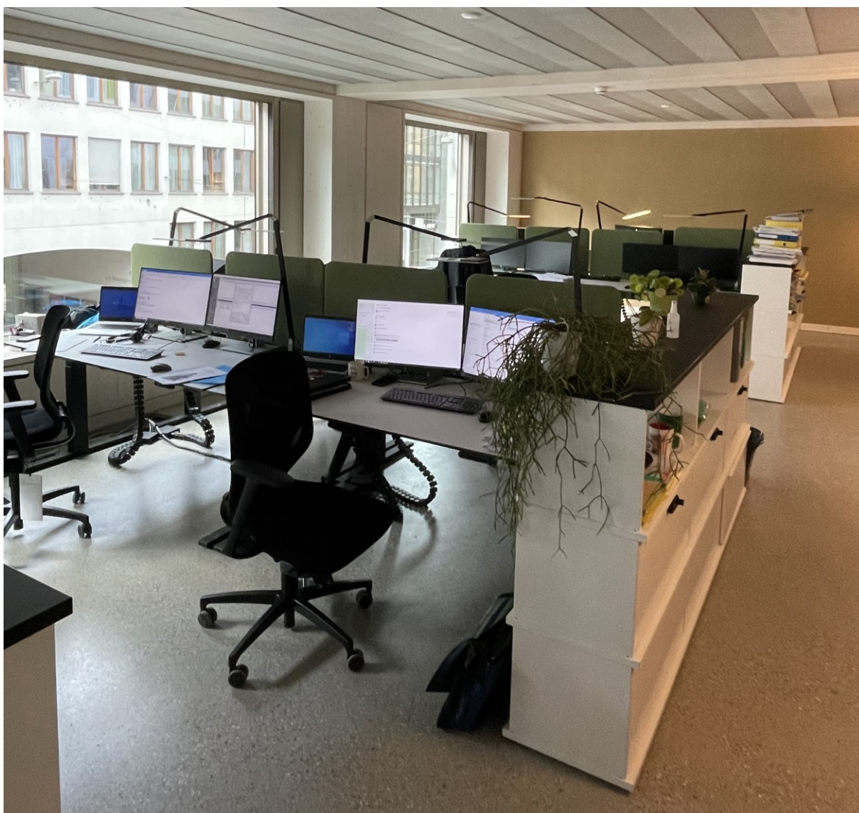
Les 12 postes de travail de chaque étage offrent tous le même confort de travail grâce à un équipement standardisé.

Reste à savoir ce qu'il est advenu des meubles qui n'ont pas trouvé de place dans le nouveau bâtiment de l'AUE. Dans l'esprit de la pensée circulaire, on a cherché ici aussi une réutilisation judicieuse: les anciennes chaises et autres meubles équipent désormais d'autres services cantonaux. Tout ce qui ne pouvait plus être utilisé, mais qui semblait tout de même utilisable, a été proposé en ligne. Avec un peu de chance, certaines collaboratrices et certains collaborateurs ont ainsi pu acheter leur ancienne chaise de bureau aux enchères.